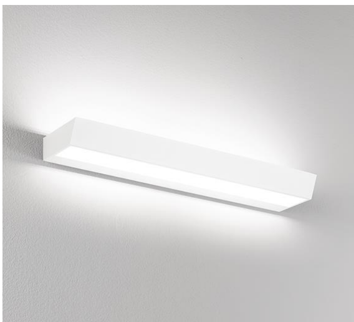
957 - 957N Bianco