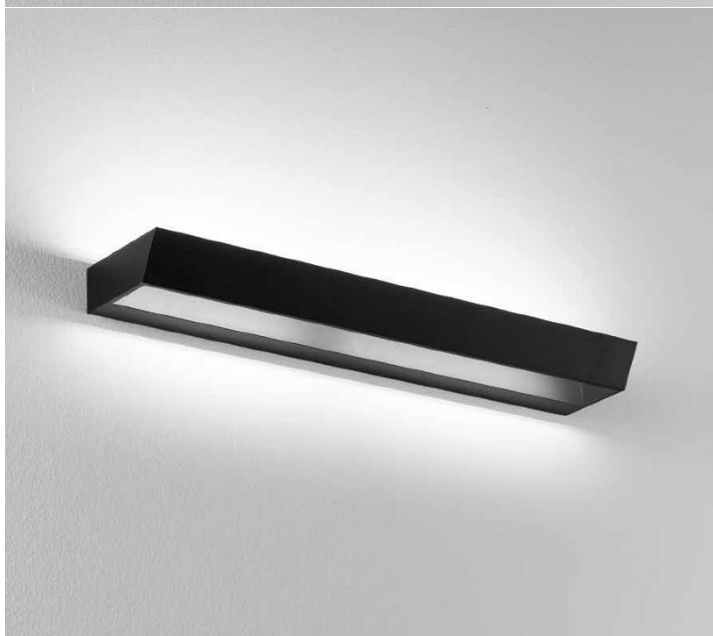
957B - 957BN Nero