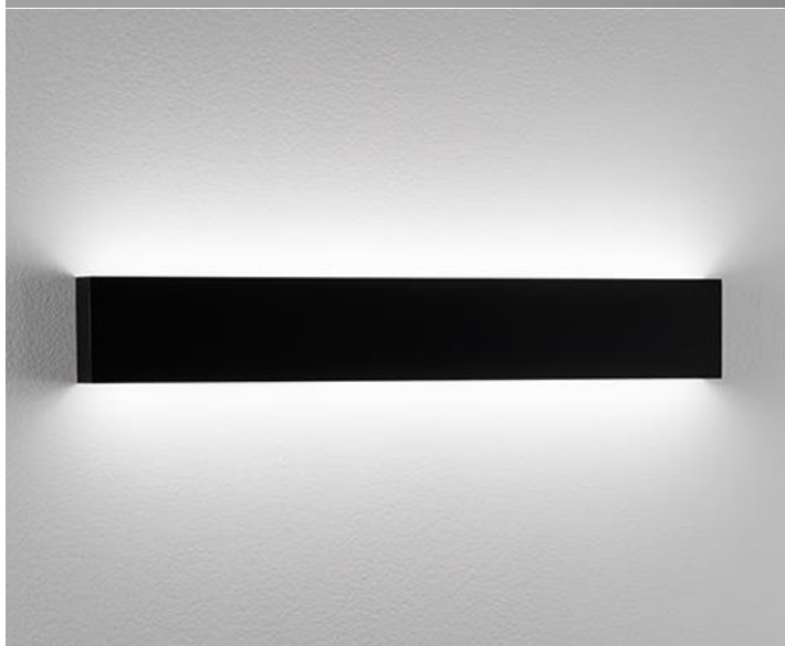
902-19B - 902-19NB Nero